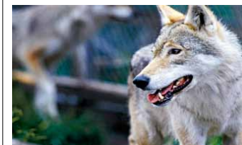
Forvaltningen av den norske ulvbestanden skal drøftes i dag.