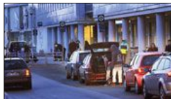
Bodø har mye å lære av Troms når det gjelder hvordan man organiserer trafikken på flyplassen.