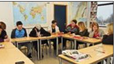
Ansatt i skolen og andre offentlige etater bør ha en mye større ytringsfrihet enn de har i dag.

For dårlig utstyrte vogntog skaper hver venter byutvikling på norske veier. Vi trenger flere tiltak for å forhindre at tunge kjøretøyer utgjør en risiko i vintertrafikken, også sett i lys av krevende konkurranse- og arbeidsvilkår i lastebilnæringsna. Et økende antall trailere skaper stor bekymring og utfordrer framkommelighet og trafiksikkerhet på vinterveiene våre, mange av disse er utenlandske vogntog. Det er det siste året satt inn en del forebyg-gende tiltak. Under den rødgrønne regjering-ben ble det innført nye krav til registrering for kjøretøyer over 3500 kg. I vinter er kontrollør av vogntog ved grenseover-gangene og på krevende veistrekninger forsterket. Det er bra. Men vi mener det vil være for ytterligere virkemidler, og vil ta saken opp i Stortinget i begynnelsen av ja-nuar. Problemen med dårlig skodde vogntog på vinterveiene må også sees i sammenheng med krevende konkurranse- og arbeidsvilkår i lastebilnæringsna. I august la Arbeiderpartiet fram en tiltaksliste som skodde dumping i transportbransjen, for å kunne oppnå mer seriositet og mindre ulovligheter i bransjen. Våre forslag til tiltak vil også ha en effekt overfor trafikkløse vogntog på vin-terveiene. Ett sentralt tiltak er å stille