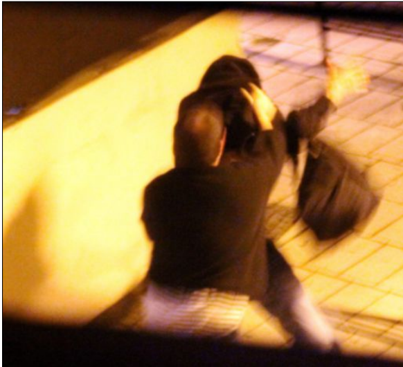
BLIND VOLD: Blind vold har direkte konsekvenser for den som er utsatt, personen sin omgangskrets, og den skaper frykt i befolkningen for øvrig, understreker artikkelforfatteren.

Forskning og dokumentasjon viser at rundt 50–60 prosent av de voldsutsatte har drukket alkohol, alt fra et glass til over-