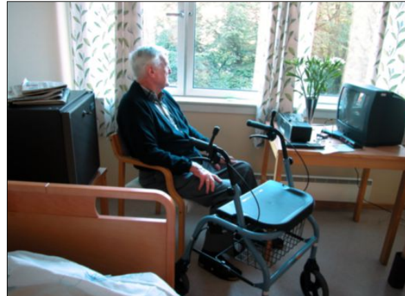
EINSEMD: Rode Kors sine aktivitetar er med på å motarbeide einsemd gjennom heile året, og mange frivillige gjer ein ekstra innsats i høgtidene.

UNDERSØKINGAR som Norges Røde Kors har gjort viser at ein av fire nordmenn er plagt av einsemd