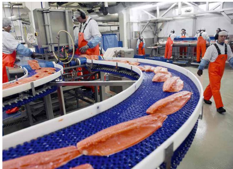
TIL VÆRS: Den tradisjonelle vestlandsbedriften Lerøy Seafood har problemer med å produsere så mye av de kan dekke etterspørselen.

Se fullverdig barstene på bt.no