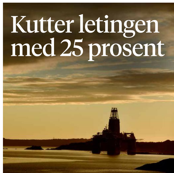
NEDGANG: En lertigg i opplag mellom Ågotnes og Askøy.

– Dette handler nok om en ny klasse profesjonelle ledere som bevisst isolerer seg fra organisasjonen og erstatter dialog med direktiver. Hovedfunnet i undersøkelsen er at to- eller trepartssamarbeid går i sterk negativ retning i norske bedrifter. Innspill fra mellomledere og andre nær ikke frem slik vi var vant med tidligere, sier Brekke til DN. NTB