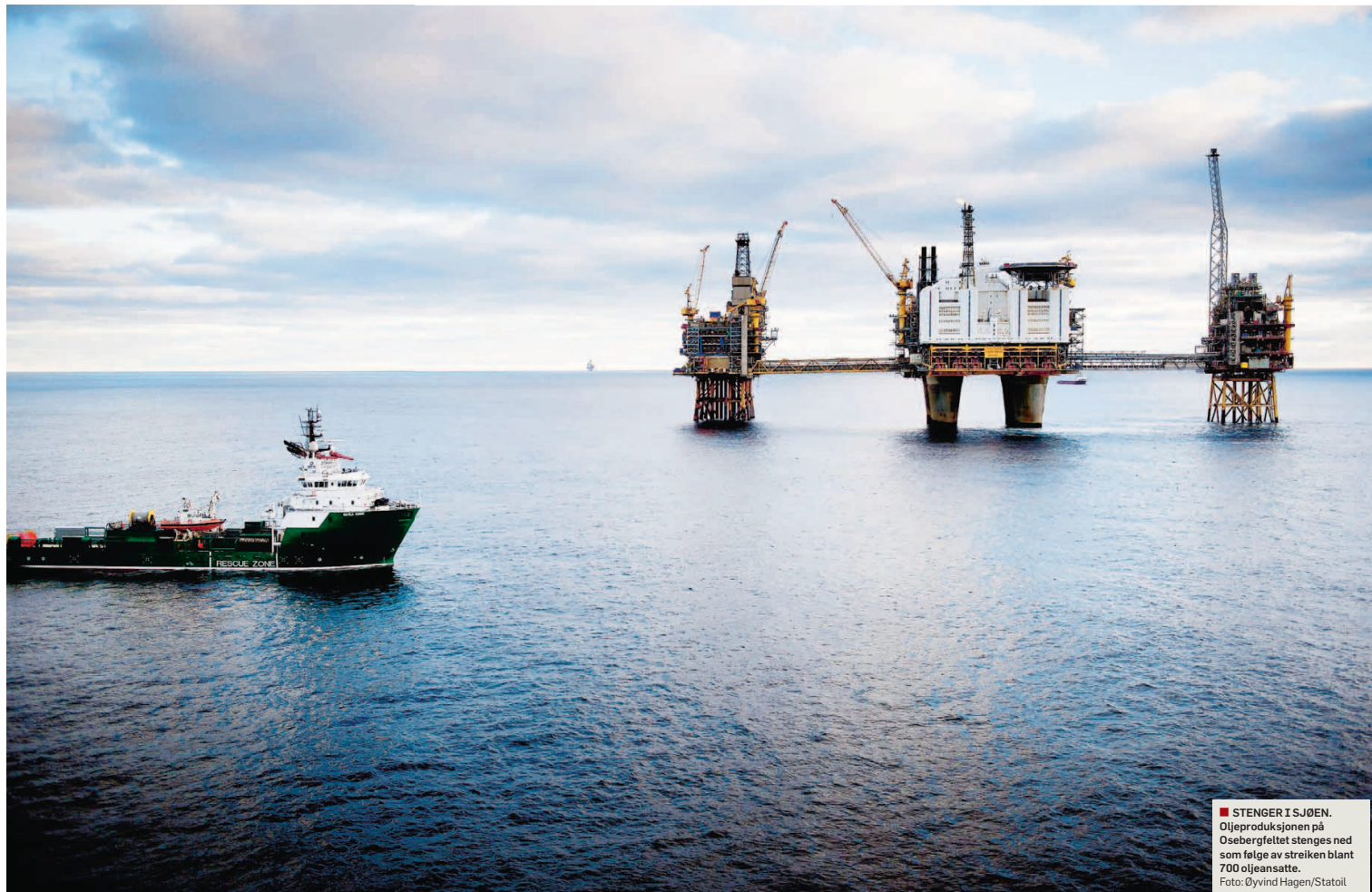
STENGER I SJØEN. Oljeproduksjonen på Osebergfeltet stenges ned som følge av streiken blant 700 oljeansatte.

Statoil oppgir at det koster selskapet mer enn 100 millioner kroner for hver dag streiken