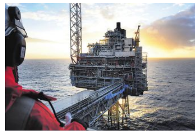
BEST LØNN: Jo nærmere du kommer oljen, jo høyere er lønnsnivået.