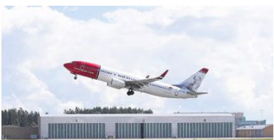
USA: Norge følger Sverige som ligger an til å bli det første skandinaviske landet som innfører forhåndsklaring for flyreisende til USA.