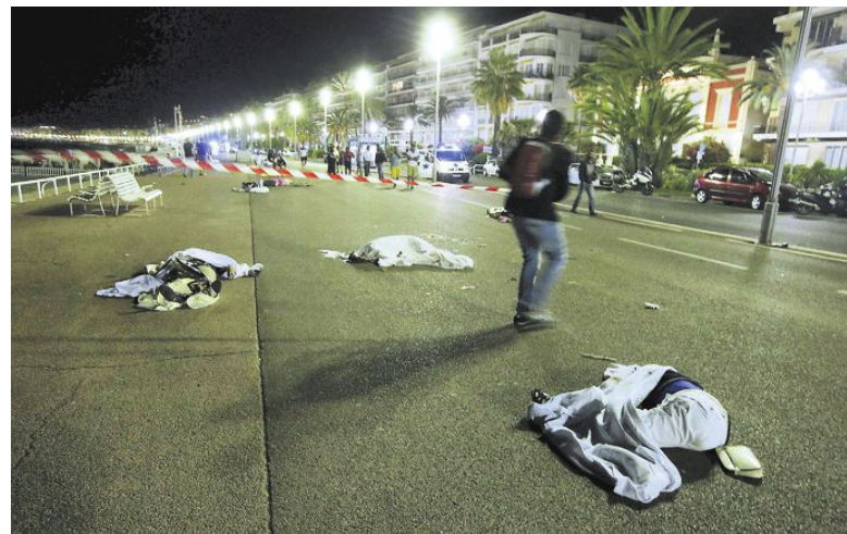
TERROR: Promenade des Anglais i Nice ble torsdag kveld forvandlet til en krigslignende sone. Minst 80 personer ble drept. Identitetspapirene til en 31 år gammel fransk-tunisiser er funnet i lastebilen etter terrorangrepet.