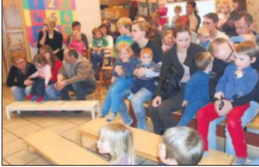
FULLT HUS: Publikumsoppstillingen var stor.