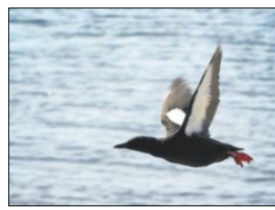
På flukt i havgapet...