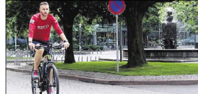
POPULÆRT: Det finnes to type motorer: hjulmonterte, foran eller bak, og krankmonterte, montert ved pedalen.

DET VAR i perioden 1995 til 1998 at Ramberg-skolen ble flyttet til Hillestad. Det var det, takk for innsatsen, håper huset blir vedlikeholdt, tenkte nok noen. Men det forbløffende skjedde at dugnaden bare har fortsatt og fortsatt på omtrent det samme styrkenivået. Når det nåværende styret på Reidvin nå kan se seg stolte omkring på et tun som veker berettiget oppsikt langt utenfor Holmestrands nåværende grenser, er det også grunn til å peke på den innsatsen som også foregående styret og enkeltpersoner har lagt ned. At også disse fortjener takk og oppmerksomhet når historien om tunet skal nedtegnes er sikkert det nåværende styret fullstendig klar over. Kanskje vi kan håpe på boka om Reidvin-tunet om noen år?