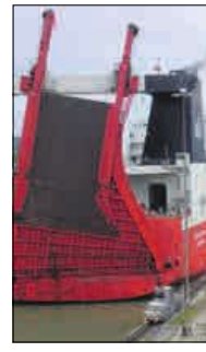
FIKK BOT: Wallenius Wilhelmsen Logistics.