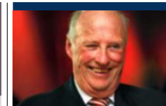
Kongen er åpen om demens.

OSLO Arveavgiften først Arveavgiften kan bli den nye regjeringens første arbeidsoppgave å bli kvitt, ifølge sentrale kilder i Høyre og Fremskrittspartiet. (NTB)