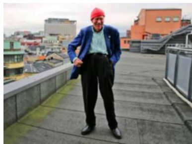
Endomskongen Olav Thon brukte helsides annonser på å rope hvilket parti han vil stemme på og fikk massiv kjefte. Truslene om boikott av hotellene hans tar han med knusende ro – og en gapskratt.

– Hvor mange stemmer skaffer du Frp, tror du? – At jeg stemmer på dem, tror jeg ikke gir så mange stemmer.