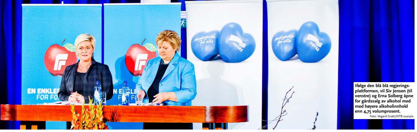
Ifølge den blå blå regjeringsplattformen, vil Siv Jensen (til venstre) og Erna Solberg åpne for gårdsalg av alkohol med enn 4,75 volumprosent.